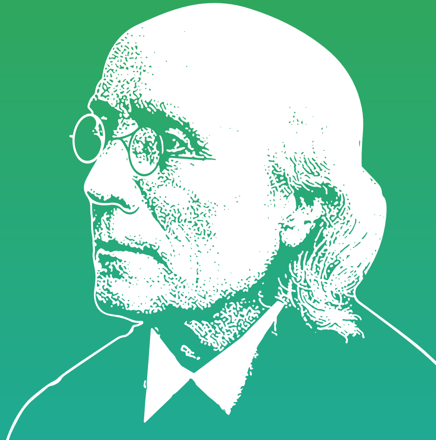
Gustav Theodor Fechner (1801–1887) Begründer der Psychophysik.